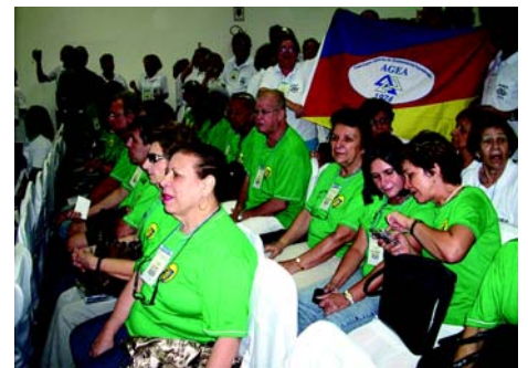
Grupo da AEA/ES na sessão solene de abertura do 30º Simpósio

Numa das principais participações do Simpósio, os economistas aposentados ouviram do Ministro da Previdência Social, José Barroso Pimentel, a boa notícia de que a proposta de alteração do artigo 115 do REG/REPLAN (modalidade saldada) foi aprovada na última instância, ou seja, na Secretaria de Previdência Complementar, depois de já ter conseguido a vitória nas instâncias anteriores (Funcef, Caixa e DEST). Com isto, considera-se que já se avançou bastante no quesito recuperação das