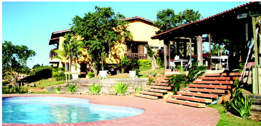
A Chácara Santa Clara Rural faz parte do circuito de agroturismo do município de Vila Velha

No dia 24 de janeiro de 2009 vamos comemorar o Dia do Aposentado. Este ano faremos um programa bem descontraído, regado a um bom churrasco, na Chácara Santa Clara Rural em Vila Velha.