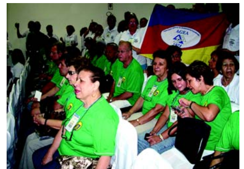
Grupo da AEA/ES na sessão solene de abertura do 30º Simpósio

Numa das principais participações do Simpósio, os economistas aposentados ouviram do Ministro da Previdência Social, José Barroso Pimentel, a boa notícia de que a proposta de alteração do artigo 115 do REG/REPLAN (modalidade saldada) foi aprovada na última instância, ou seja, na Secretaria de Previdência Complementar, depois de já ter conseguido a vitória nas instâncias anteriores (Funcef, Caixa e DEST). Com isto, considera-se que já se avançou bastante no quesito recuperação das