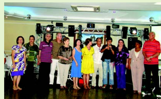
Grupo da Grande Vitória

Mas se a saudade apertar, apareça na AEA.