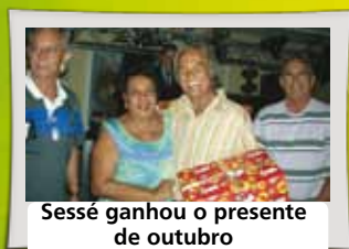
Sessão ganhou o presente de outubro