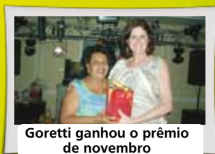
Goretti ganhou o prêmio de novembro