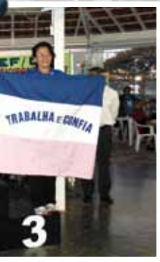
do, levou a medalha 10 km, até 59 anos"