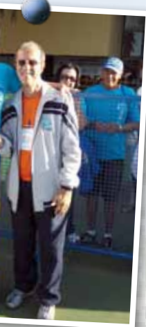
recebeu medalha de nado costas, feminino"

Já essa turma mostrou que é campeã de vitalidade, disposição e simpatia e promete treinar muito para presentear a AEA/ES com mais medalhas. Valeu, meninos e meninas! Vocês são Atletas Especiais e Amigos do Esporte e da Saúde .