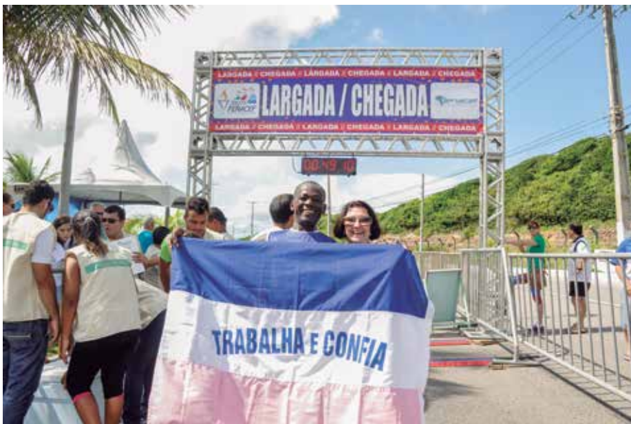
Dada a largada para o VII Jogos Fenacef. As seletivas da AEA/ES é a oportunidade para você parte da delegação do Espírito Santo