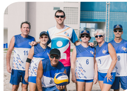
Equipe de Vôlei de Areia