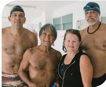
Equipe de Natação