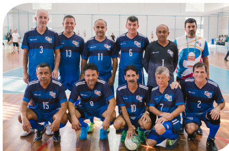
Equipe de Futsal Masculino