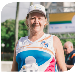
Bernardete - Corrida de Rua 5 Km e 10 Km