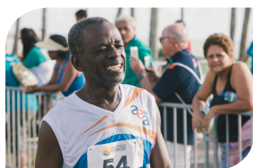
Mirandinha - Corrida de Rua - 5 Km e 10 Km