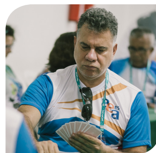
Tonhão - Canastra