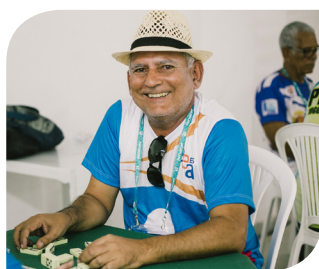
Tytoni - Dominó